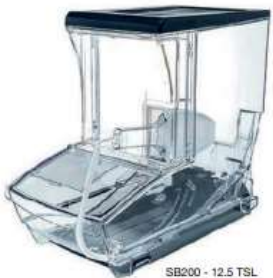
SB200 - 12.5 TSL